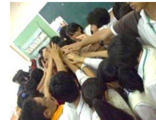
都立田無高等学校との生徒会交