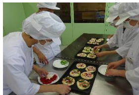
作業学習：食品加工