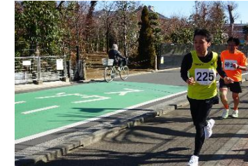
陸上部 (長距離走等)