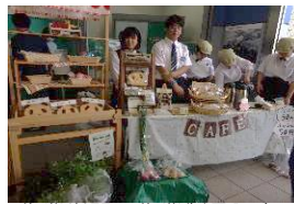
作業学習：作業製品販売 (田無駅改札横スペース)