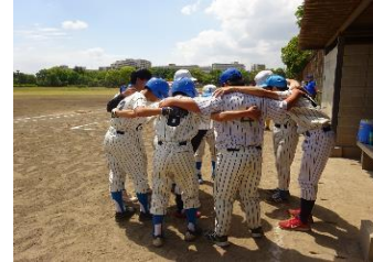
球技部 (ソフトボール等)

○球技部、陸上部、表現活動部、オセロ部の4部活動及び生徒会活動があり、生徒の心身の健康育成や卒業後の余暇活動の充実につながる指導を展開しています。