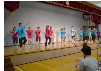
表現活動部 (ダンス等)